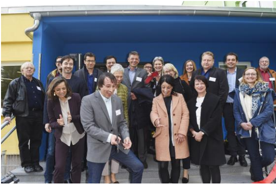
Die anwesenden Förderer des BOLLE-Baus beim Durchschneiden des roten Bandes

Wesentliche Beiträge zum finanziellen Gelingen leisteten Sternstunden e.V., Deutsche Fernsehlotterie, TRIBUTE TO BAMBI Stiftung, Bild hilft e.V., Futura Stiftung, Udo Grüninger Stiftung, IKEA Stiftung, Star FM 87,9, Witte Projektmanagement GmbH, HW-Ingenieure, radioBERLIN 88,8, Dirk Nowitzki Stiftung, Berliner Glas KG und andere.