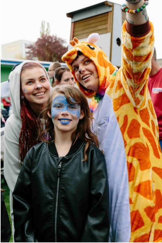
Bunt wie BOLLE schminkten wir auch die Kindergesichter

1 – Endlich Platz bei BOLLE 2 – Neues digitales Gewand