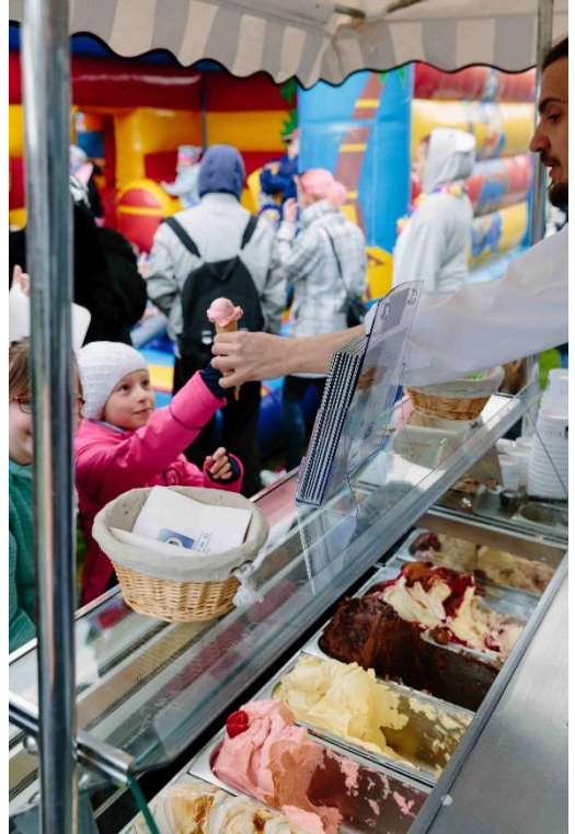
Die Gäste genossen Eiskimo-Eis und viele weitere Leckereien

Straßenkinder e.V. hat in das gesamte Bauvorhaben rund 2,1 Millionen Euro investiert. Hiervon flossen ca. 1,7 Millionen Euro in den Neubau und mit weiteren 400.000 Euro konnte der Altbau saniert werden. Das Projekt wurde aufgrund des bestehenden Förderbedarfes der Kinder und Jugendlichen initiiert, da die Räume in dem alten Gebäude schnell zu klein wurden. Das Besondere an diesem Vorhaben ist die Finanzierung, welche ausschließlich durch private Spenden ermöglicht wurde.