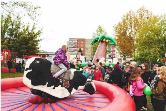
Auf 3 Hüpfburgen, dem Trampolin und dem Bullriding-Bullen wurde sich so richtig ausgetobt